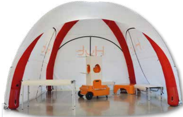
Système tout-en-un, la Hut' se transforme en un espace d'accueil complet